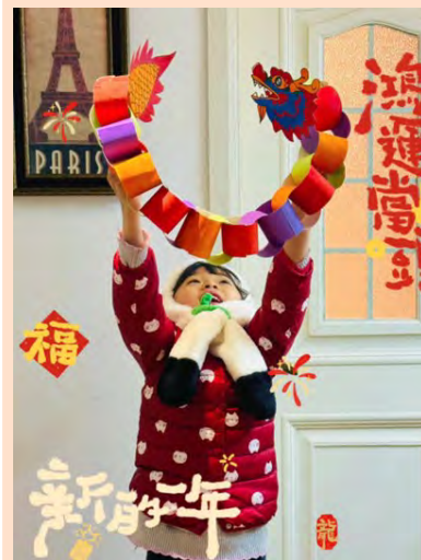
◎《龙腾迎新》(手工作品)